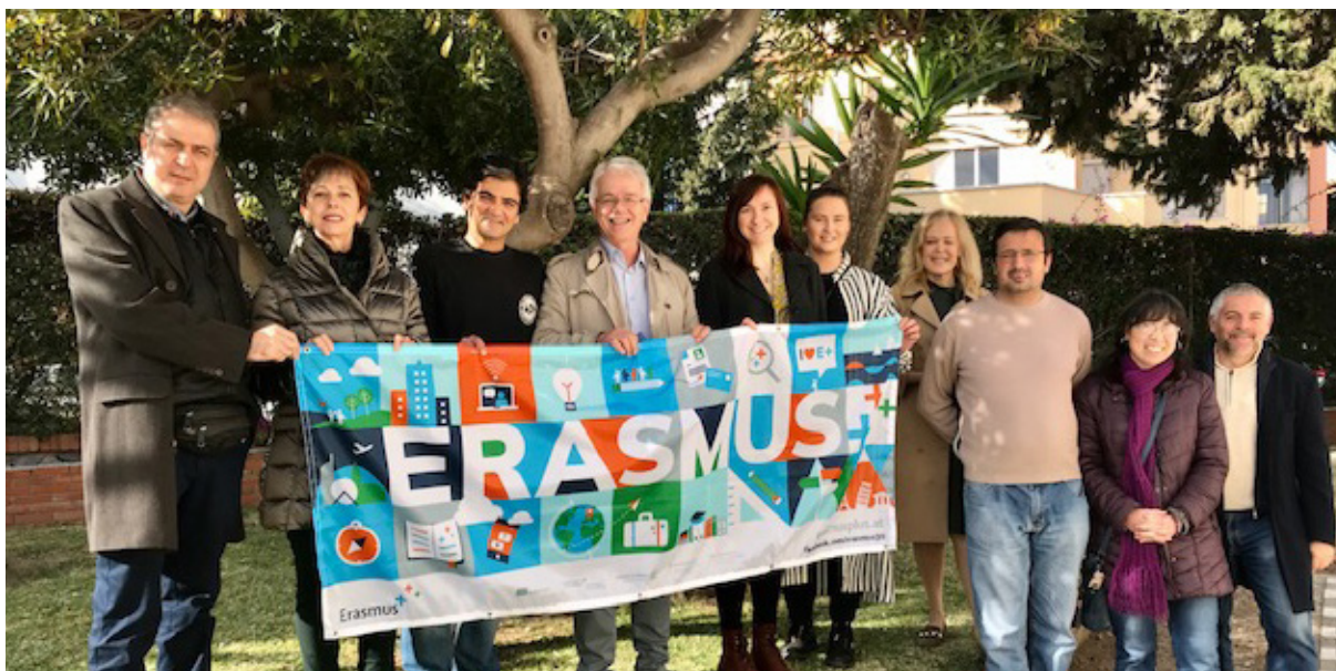
Účastníci úvodného stretnutia projektu SSE v Malage